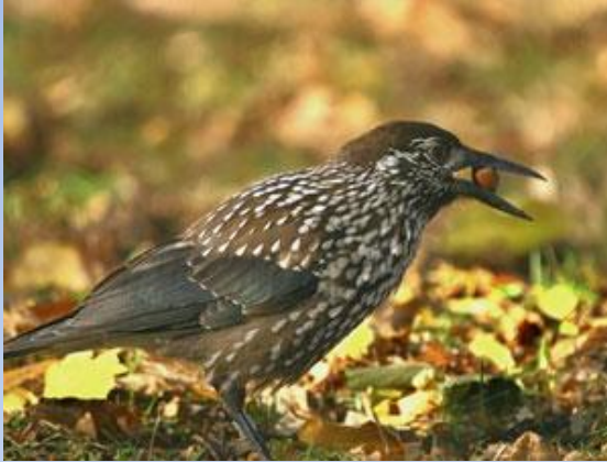
gaița de munte